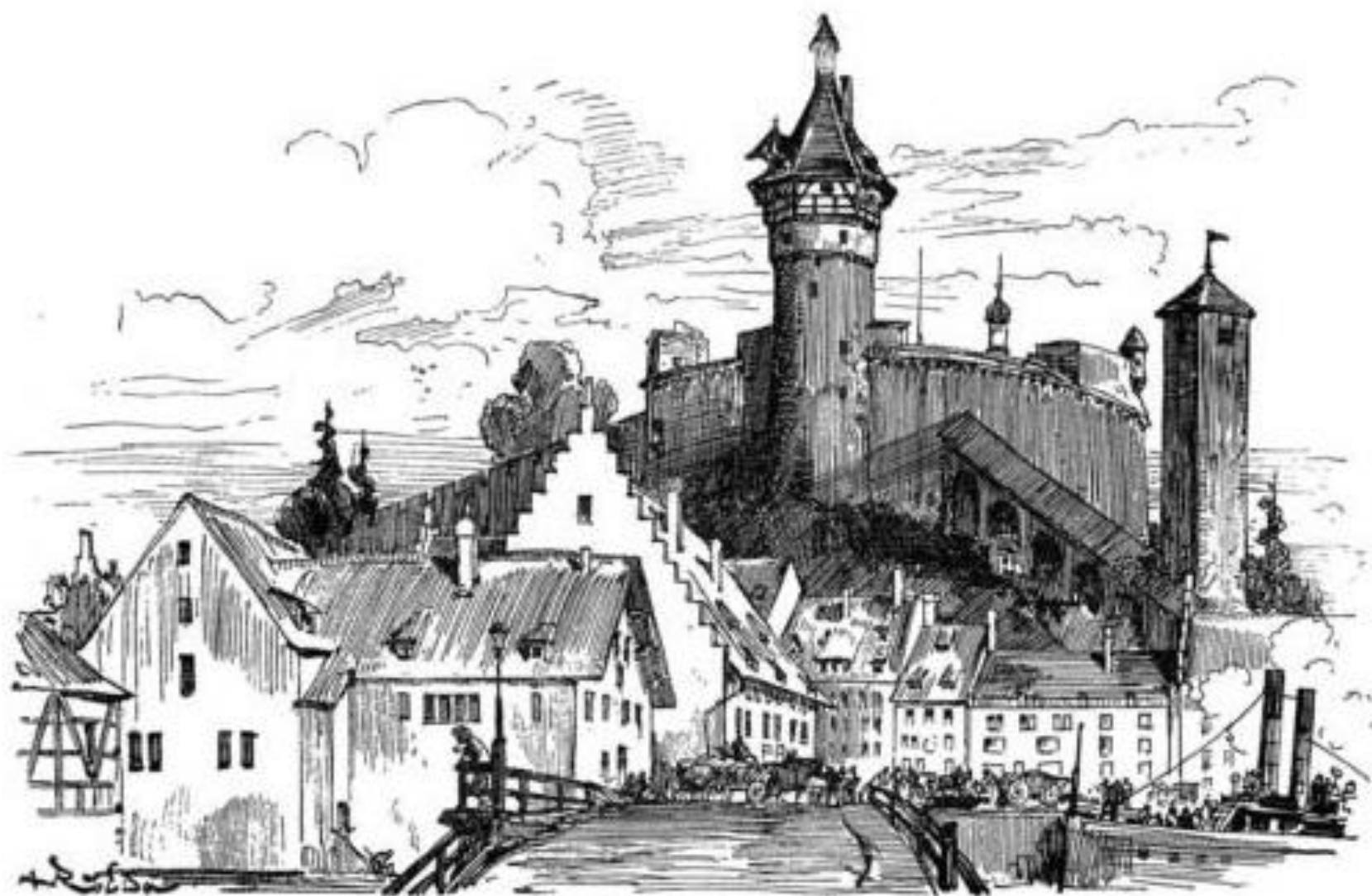
Schaffhouse. — Le château de l'Unnoth.